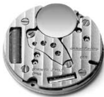
Калибр Jaeger-LeCoultre 688.