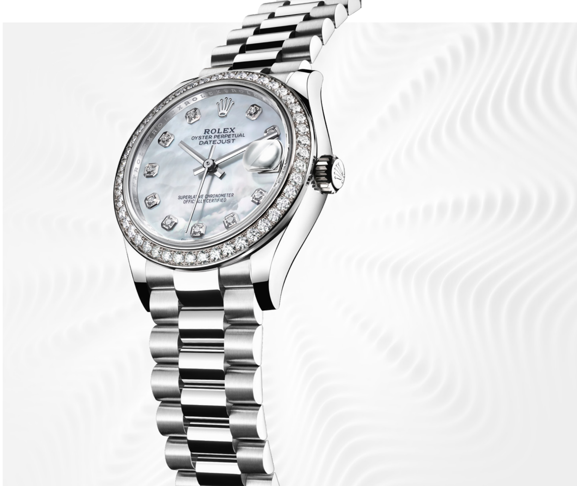
OYSTER PERPETUAL DATEJUST 31