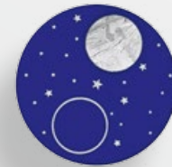
Диск лунных фаз

Кроме того, часы Cellini Moonphase располагают функцией календаря с центральной стрелкой, полумесяц на кончике которой показывает текущую дату по окружности циферблата. Эта новая модель приводится в движение механизмом с автоматическим подзаходом, полностью изготовленным Ролексом. В механизм интегрирован запатентованный модуль лунных фаз, астрономическая точность которого гарантирована в течение 122 лет. Часы Cellini Moonphase предлагаются с браслетом из коричневой кожи аллигатора с застежкой Crownclasp из 18-каратного золота Everose с раскладывающейся пряжкой, впервые примененной для модели часов коллекции Cellini.