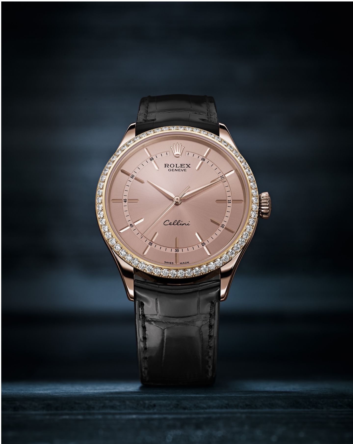
CELLINI TIME – 50705 RBR 18-КАРАТНОЕ ЗОЛОТО EVEROSE – БЕЗЕЛЬ, УКРАШЕННЫЙ 62 АЛМАЗАМИ БРИЛЛИАНТОВОЙ ОГРАНКИ РОЗОВЫЙ ЦИФЕРБЛАТ