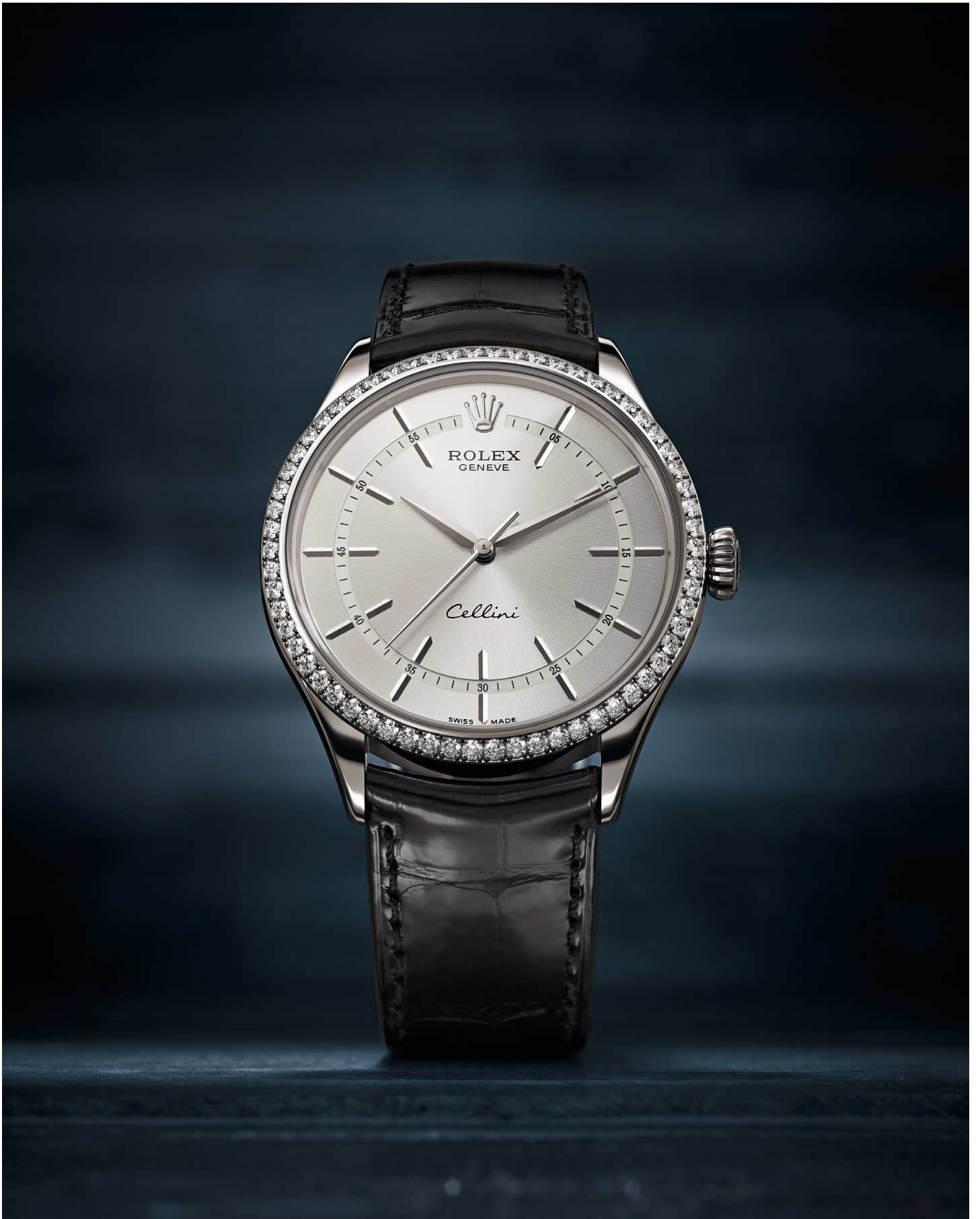
CELLINI TIME – 50709 RBR 18-КАРАТНОЕ БЕЛОЕ ЗОЛОТО – БЕЗЕЛЬ, УКРАШЕННЫЙ 62 АЛМАЗАМИ БРИЛЛИАНТОВОЙ ОГРАНКИ РОДИЕВЫЙ ЦИФЕРБЛАТ