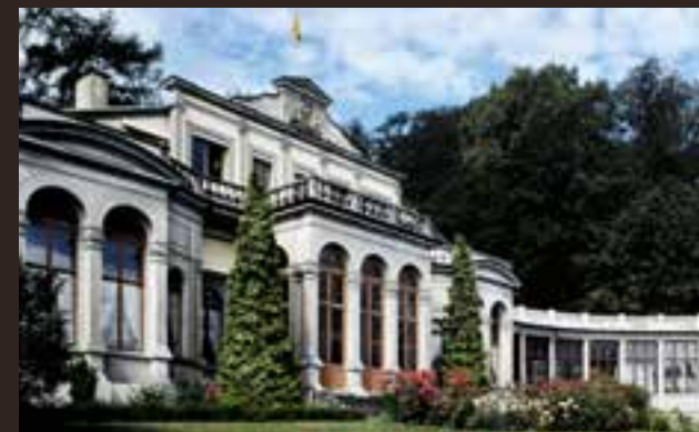
Выше: Усадьба Charlottenfels, около г. Шаффхаузен, в которой сейчас находится музей семьи Мозер (Moser Family Museum).