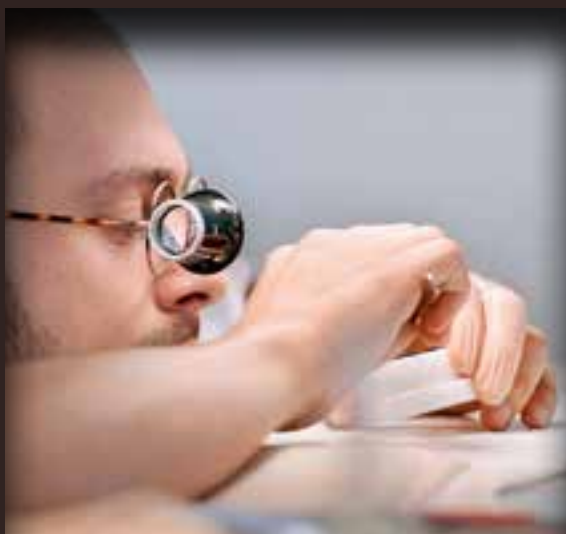
Часовой механизм в процессе создания.

Мы считаем, что собственное производство является залогом нашего успеха. Наличие у компании отдела исследований и разработок, технического отдела и сборочного цеха гарантирует высокоэффективное производство большинства деталей механизмов часов H. Moser, а также разработку собственных технических и дизайнерских концепций. Это позволяет нам контролировать качество продукции на каждом этапе, что отличает нас от других производителей современных часов.