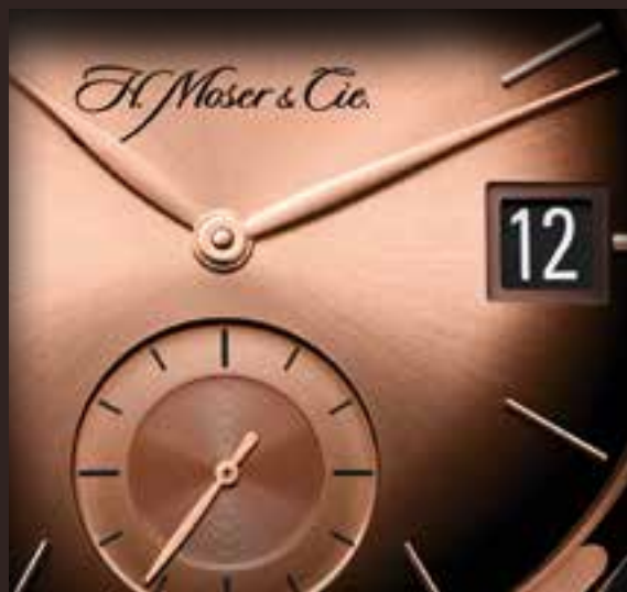
Указатель даты на отметке «3 часа» на модели Venturer Big Date.

Часы H. Moser имеют один из самых больших указателей даты в виде окошка среди других марок. В моделях Endeavour Big Date и Perpetual Calendar указатель находится на отметке «3 часа». Он состоит из двух дисков с датами, которые расположены один над другим. Это уникальная функция, которая гарантирует, что каждая цифра, независимо от её размера, будет отображаться по центру указателя даты, и не потребует ведущего нуля или глухой панели. Благодаря двухпозиционной заводной головке дату можно легко установить, не опасаясь сбить показания времени. Значение даты можно корректировать в любом направлении.