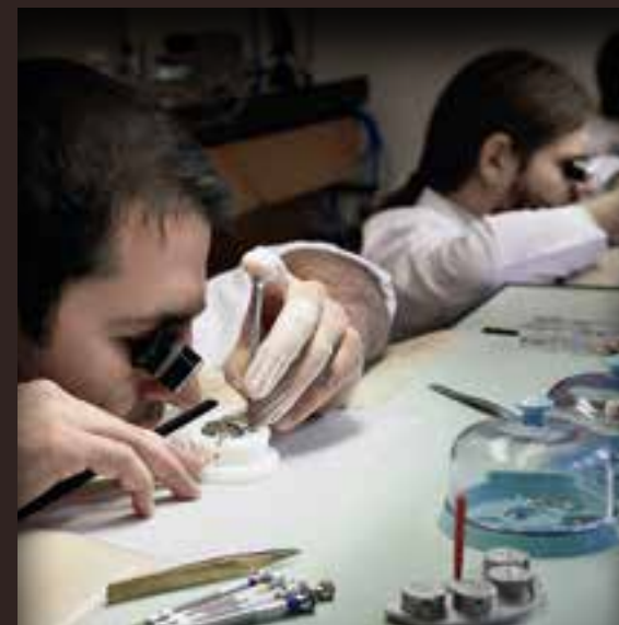
Мастера в часовом ателье H. Moser & Cie.

Наших сотрудников отличают мастерство, энтузиазм и терпение. Только лучшие мастера могут собирать наши сложные механизмы. Для сборки 350 деталей механизма Perpetual Calendar требуется одна неделя, а для проверки качества перед выпуском изделия – не менее 20 дней. Исключительные стандарты качества делают каждые часы H. Moser действительно уникальными.