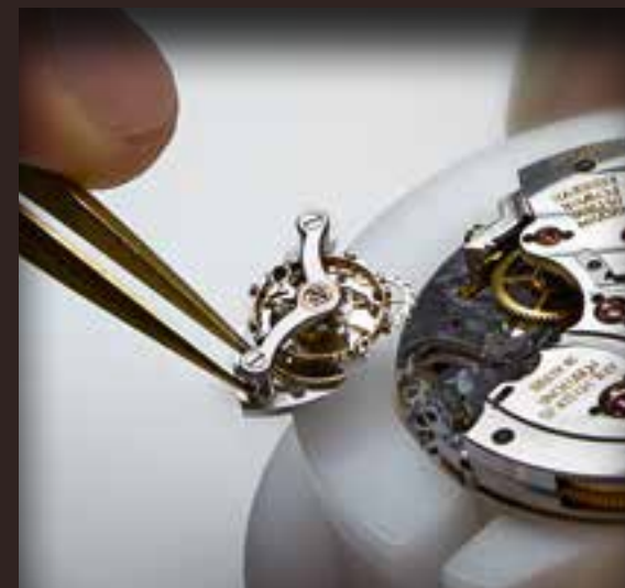
Модуль анкерного спуска Moser с оригинальной спиралью Straumann Hairspring®.

Далее выполняется очистка, осмотр и регулировка механизма и модуля анкерного спуска. Затем часы смазываются маслом для высокоточных механизмов. После этого часовой механизм устанавливается обратно в очищенный ультразвуком корпус и тестируется в течение двух циклов запаса хода. При этом также проверяется водонепроницаемость. Мы заботимся о качестве нашей продукции, поэтому модели марки H. Moser имеют двухлетнюю гарантию.