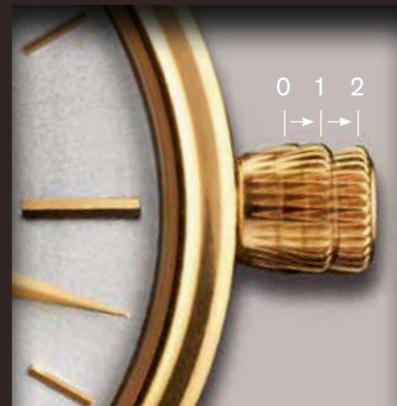
Варианты расположения двухпозиционной заводной головки.

Многие модели часов с указателем даты или второго часового пояса имеют двухпозиционную заводную головку. Такая заводная головка имеет два рабочих положения. Первое положение используется для настройки даты или времени второго часового пояса, второе – для остановки механизма и настройки времени. Если часы имеют двухпозиционную заводную головку, они продолжают идти во время настройки даты и дополнительных указателей.