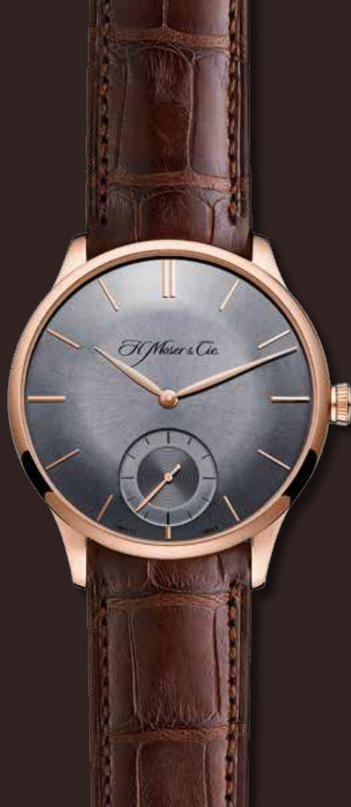
VENTURER SMALL SECONDS