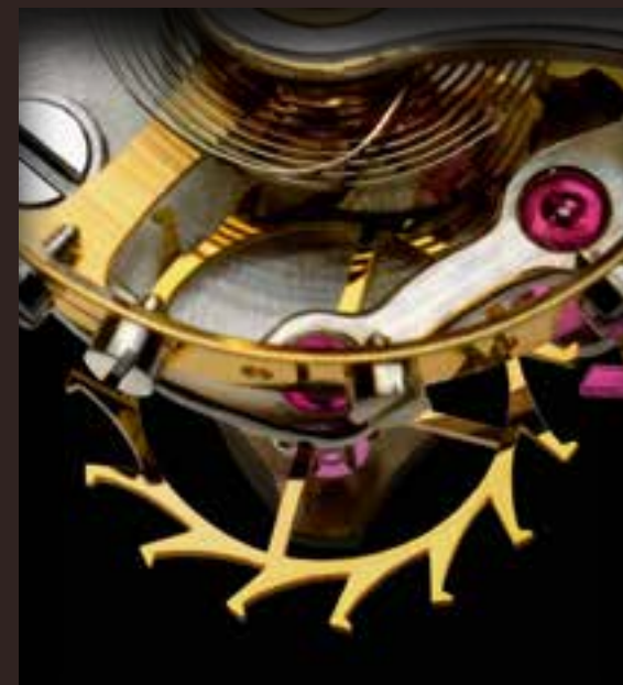
Анкерное колесо из 18-каратного золота.