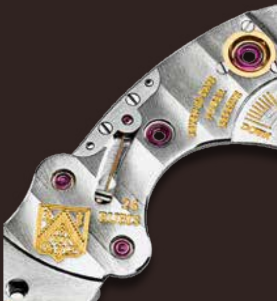
Мост модели HMC 343 Centre Seconds.