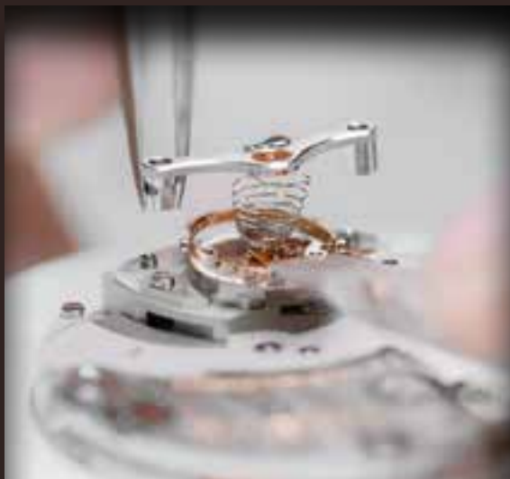
Баланс со спиралью Straumann Hairspring® и завитком Бреге.

Балансовые спирали Straumann®, которые мы производим из специального сплава, позволяют сделать наши часы невероятно точными. Эти спирали гарантируют стабильность центра тяжести баланса даже при изменениях температуры. Проволока, из которой изготавливаются спирали, проходит через ряд штампов и протягивается с точностью до тысячных долей миллиметра. Все они производятся исходя из технических характеристик конкретной модели.