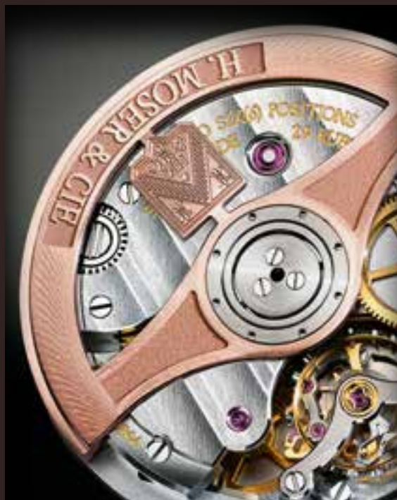
Ротор модели Endeavour Dual Time из 18-каратного красного золота.