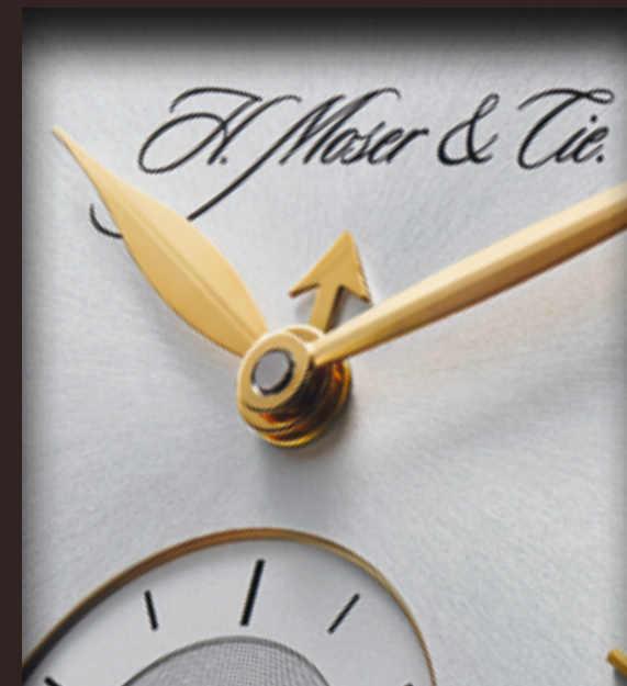
Малая стрелка указывает номер текущего месяца при помощи часовых меток.

Наша модель Perpetual Calendar получила широкую известность благодаря своему минималистичному дизайну и новаторскому решению: для указания месяца короткая центральная стрелка использует часовые метки на циферблате. Такое решение в модели Perpetual Calendar было удостоено приза на Женевском Гран-при высокого часового искусства в 2006 году.