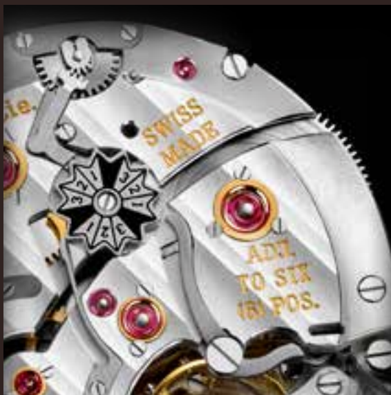
Мосты модели HMC 341, декорированные гильше «Полосы Moser».

Ключевые детали часового механизма, мосты и платины, требуют особого внимания при производстве. Необходимо не менее 87 инструментов и два часа времени для производства основной платины механизма Perpetual Calendar. Только самые опытные программисты способны настроить наши станки таким образом, чтобы гарантировать микронную точность.