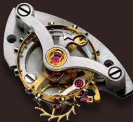
Модуль анкерного спуска Moser с золотым анкером и рубиновыми палетами.

Модель Endeavour Perpetual Calendar отличается необычайно большим окном указателя даты с механизмом мгновенной смены показаний календаря (Flash Calendar).