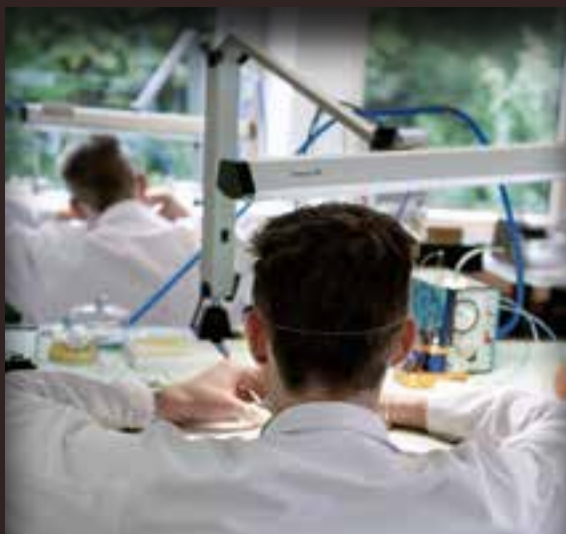
Часовое ателье компании H.Moser & Cie.

Как счастливый обладатель уникальных часов H. Moser, Вы хотите обеспечить им максимально долгий срок работы. Этого можно добиться, если Ваши часы будут проходить сервисное обслуживание у квалифицированного часового мастера, по меньшей мере, каждые пять лет. Регулярное обслуживание имеет критически важное значение для поддержания работоспособности и предотвращения или значительного сокращения износа механических