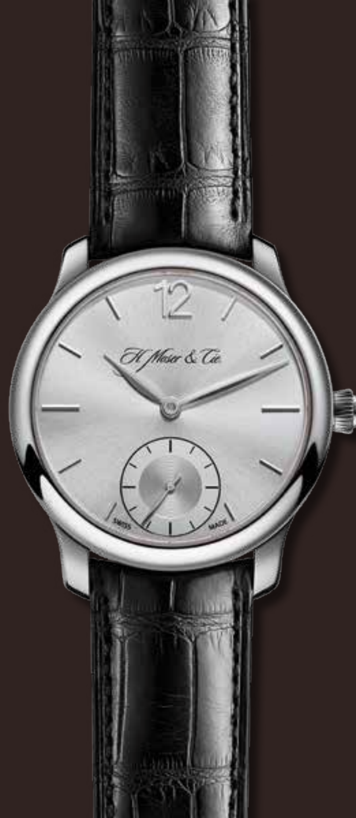
ENDEAVOUR SMALL SECONDS