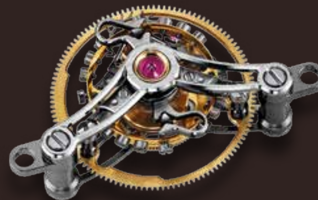
Сменный модуль турбийона Moser (совершающего один оборот за минуту) с двойной спиралью Straumann Double Hairspring®.

Механизм часов, как правило, имеет анкерный спуск или турбийон с одной балансовой спиралью, регулирующей точность хода. Двойная спираль Straumann Double Hairspring®, устанавливаемая далеко не в каждом часе, является эксклюзивной и практичной разработкой, которая сводит к минимуму влияние силы гравитации на работу баланса и гарантирует точность хода вне зависимости от положения часов.