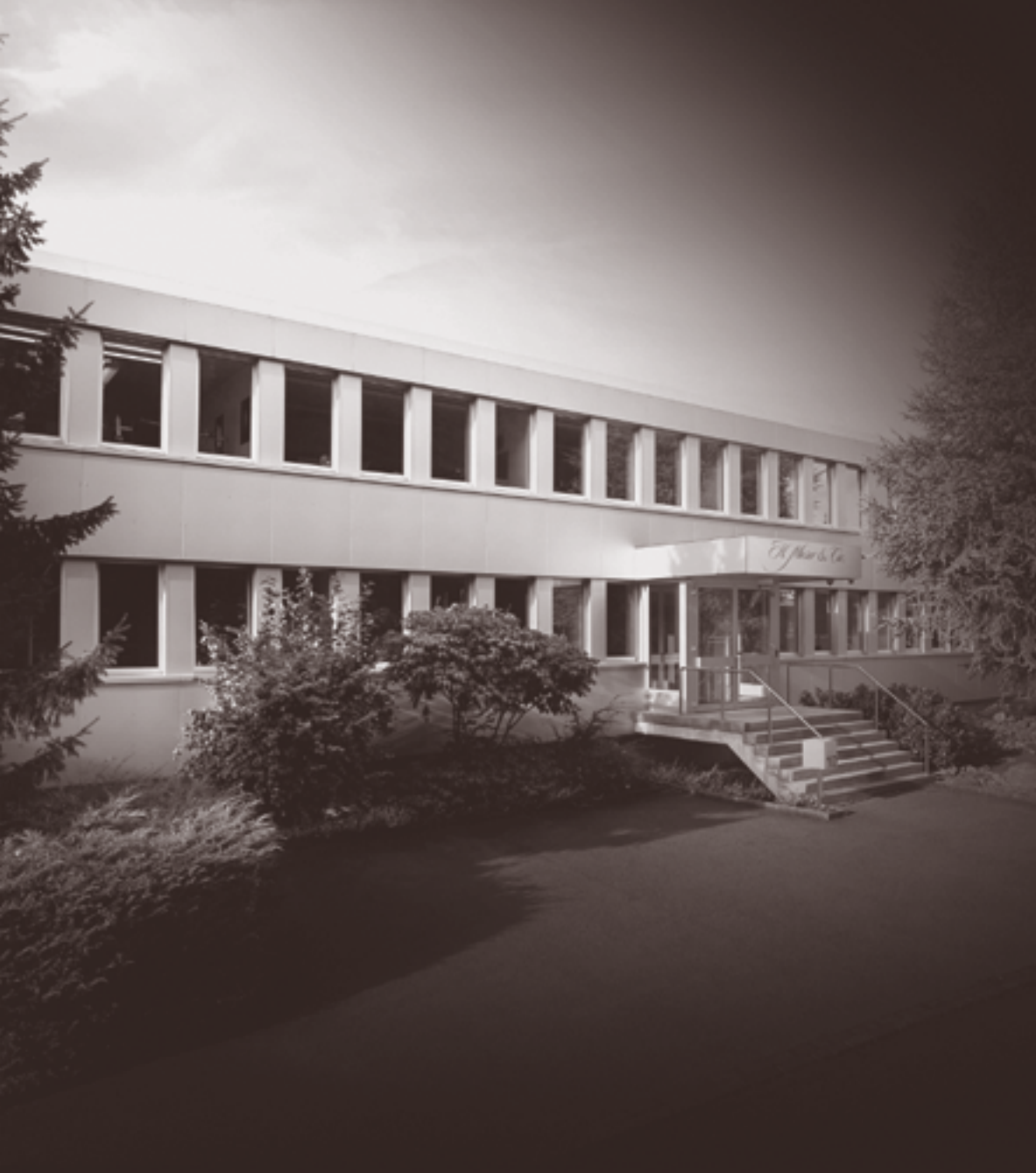
Выше: здание компании H. Moser & Cie. в Нойхаузен-ам-Райнфаль.