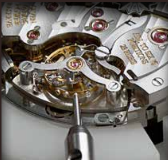
Установка винтов в колесо баланса.

деталей, который приводит к снижению точности или отключению отдельных функций, например, календаря с мгновенной сменой показаний. Опытные и квалифицированные мастера на заводе в Швейцарии и в сертифицированных сервисных центрах по всему миру выполняют аккуратную разборку модели H. Moser. После этого мастер извлечет механизм из корпуса, предварительно сняв стрелки и циферблат.