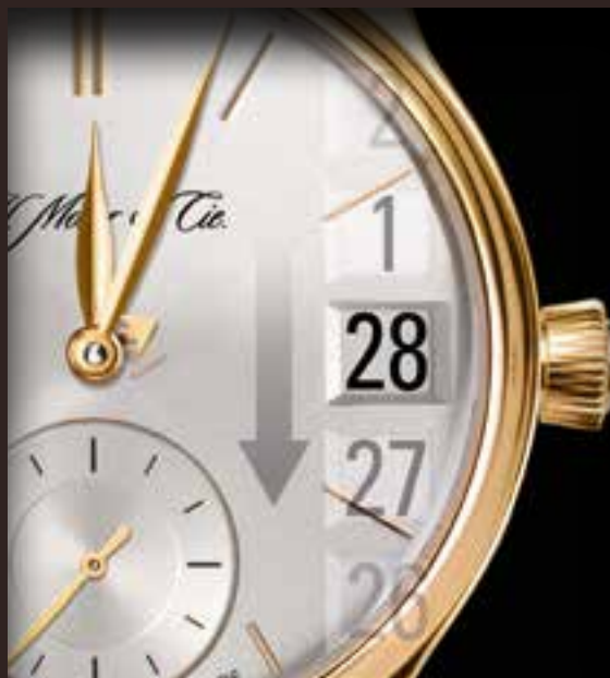
Механизм мгновенной смены даты модели Endeavour Perpetual Calendar.