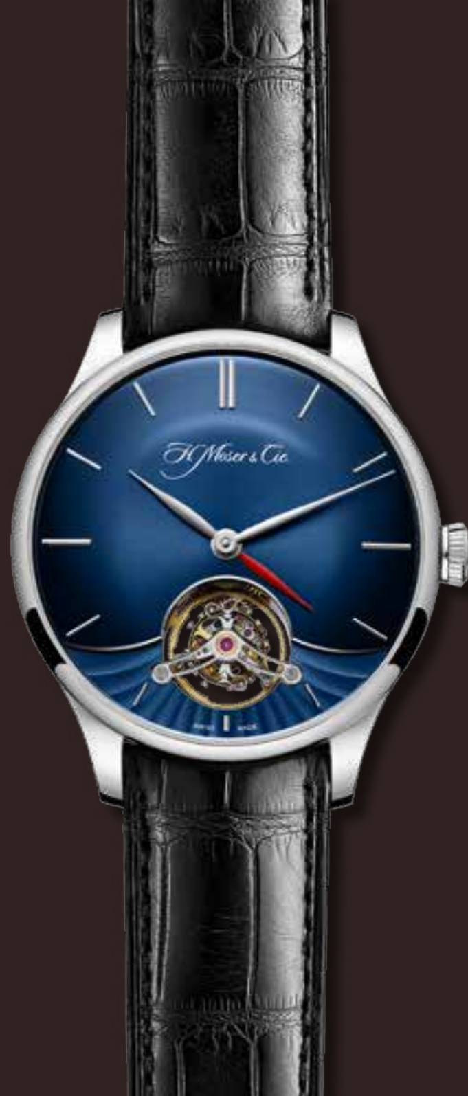
VENTURER TOURBILLON DUAL TIME