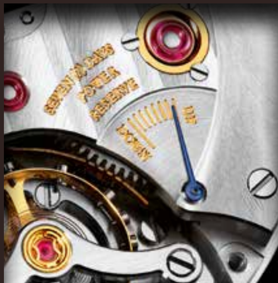
Указатель запаса хода, модель Endeavour Centre Seconds.

Среди наших моделей есть часы с 7-дневным запасом хода, что заслуживает особого внимания, если учесть небольшие размеры часового корпуса. Это достигается использованием заводных барабанов с пружинами, изготовленными из сплава Nivaflex. У большинства наших моделей указатель запаса хода расположен с оборотной стороны механизма и виден через сапфировое стекло задней крышки корпуса.