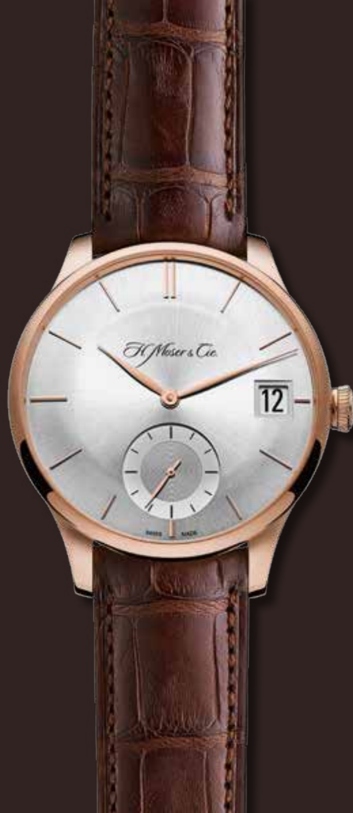
VENTURER BIG DATE