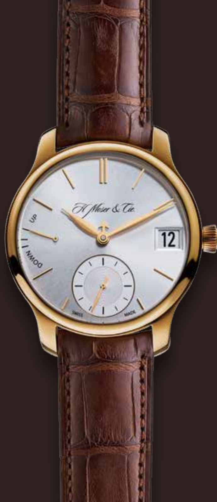
ENDEAVOUR PERPETUAL CALENDAR