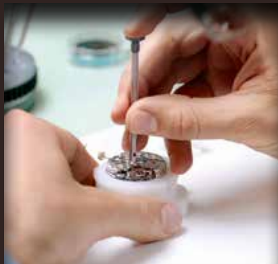
Установка анкерного спуска в часовой механизм.

Мастер скручивает тончайшую проволоку в пружину и термически обрабатывает ее в вакуумной печи. После этого высокопрофессиональный специалист по изготовлению балансовых спиралей фиксирует металлическое кольцо по центру, а из наружного края формирует концевую специальную форму (завиток Бреге). Использование балансовых спиралей собственного производства и отсутствие зависимости от других поставщиков высоко ценятся любителями часового искусства.